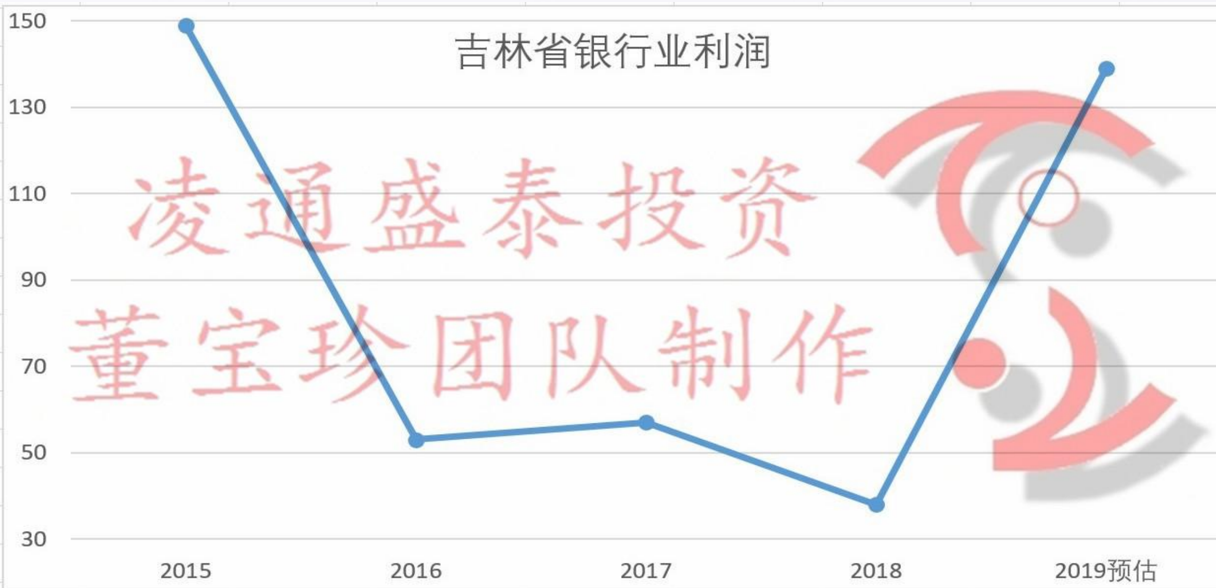
吉林省银行业利润